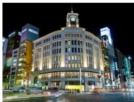
Avez-vous remarqué le Godzilla sur la 2 e photo ?